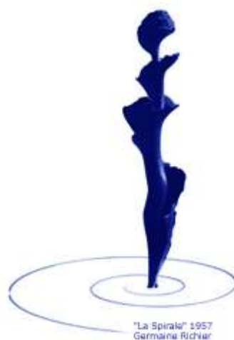
"La Spirale" 1957 Germaine Richier